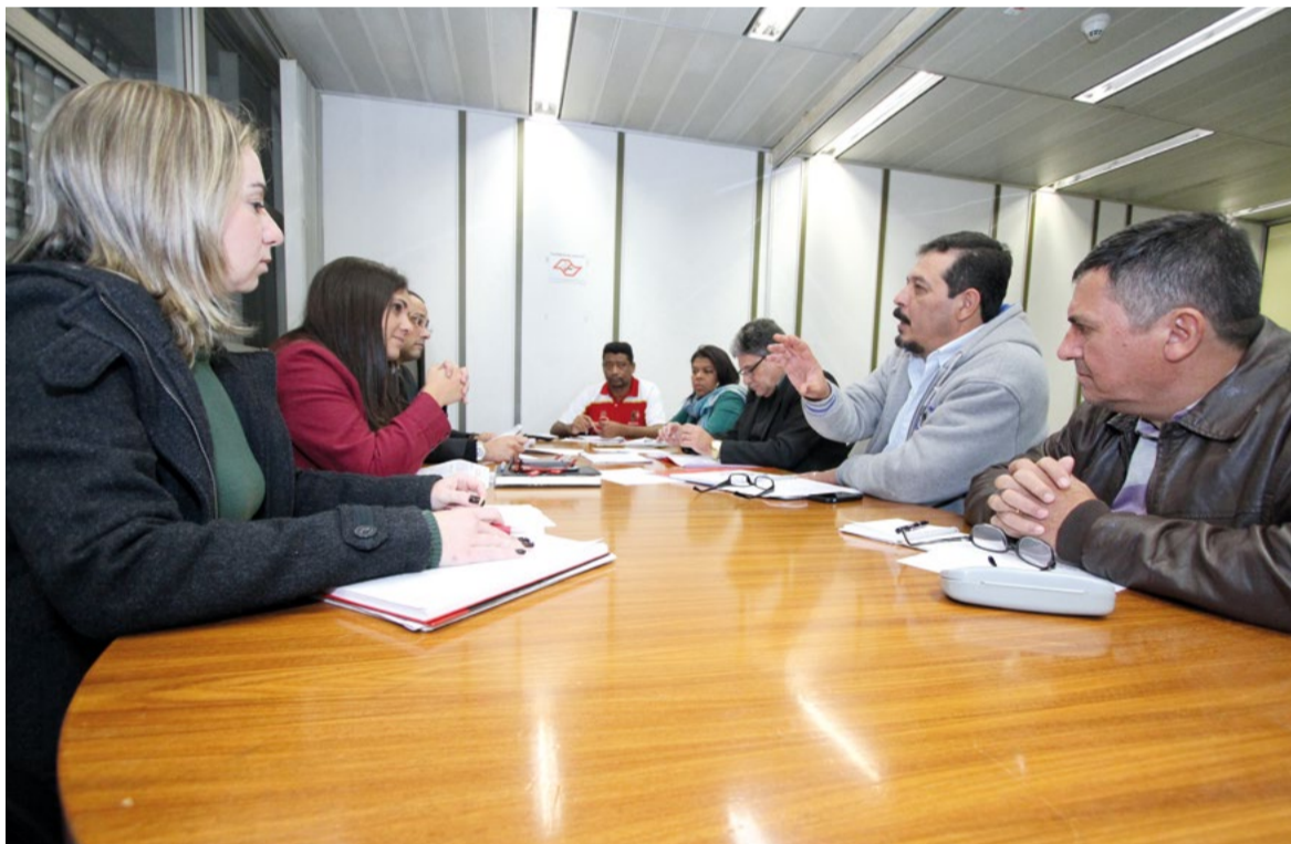
Acima: mesa de negociação ontem com a Estamparia. Abaixo: negociação quarta-feira com o G10

A Campanha Salarial 2016 tem como tema “Sem pato, sem golpe, por mais empregos e direitos”. A pauta tem cinco itens principais: não à tercei-